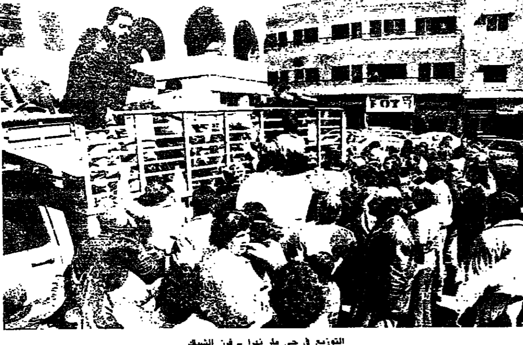
التوزيع في حي مار نورا - فرن الشباك

الحصص الغذائية المساعدات الغذائية التي وزعت امس. قسمت حصصا. تضمنت كل منها المواد التالية: رز. سكر. حمص. فول. معكرونة. مربي. صابون. طون. جبة. لحم. حليب. زيت. المساعدات الطبية المساعدات الطبية التي انطلقت على اودية للاطفال والمسنين. بينها مضادات حيوية. وادوية للاسهال. والسطة. والتشنج. والرعج. والاذن. بالإضافة الى مطهرات جلدية. لقطة اتناء التوزيع في حي السموط في عين الرمانة. اسرعت قافلة طالب بحصة وهي تبكي. سلت من انت. احابت ابي مات. وامي مصلية. وانا من حقي ان احصل على مساعدة. وكان لها ما طلبت. مع قيلة